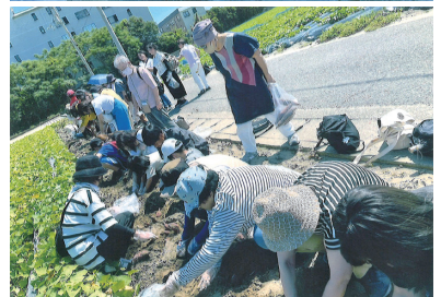
大きな金時いもをたくさん掘ることができ、うず潮を近くで観ることができ、楽しい1日でした！