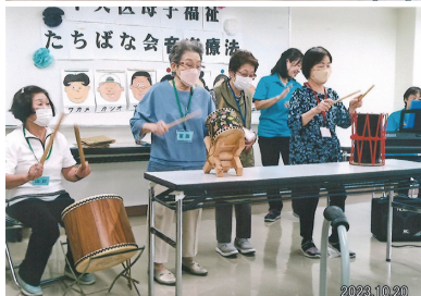
♪みんなで歌ったり、太鼓をたたいたり、身体を動かしたりしました。音楽は心を豊かにします。