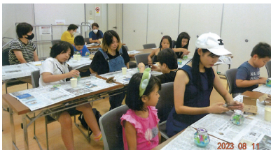
大人も子供と一緒に楽しく工作ができました！