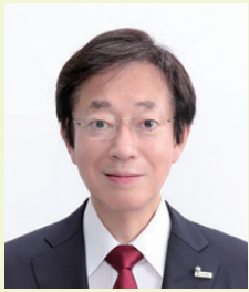
神戸市長 久元 喜造