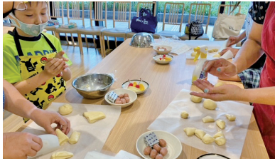
夏休みに親子で、たこ焼パンとフルーツカスタードパンを作り、焼きたてのパンを皆で美味しくいただきました(*^-^*)