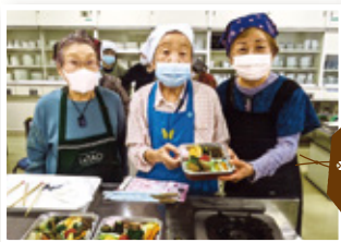
3月 「食育勉強会&お弁当づくり (持ち帰り食べました)」