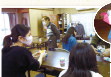
3月 折り紙教室を開催しました!