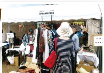
神戸まつりに 出店しました