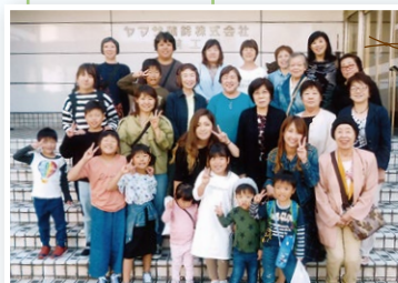
ヤマサ蒲鉾 工場見学